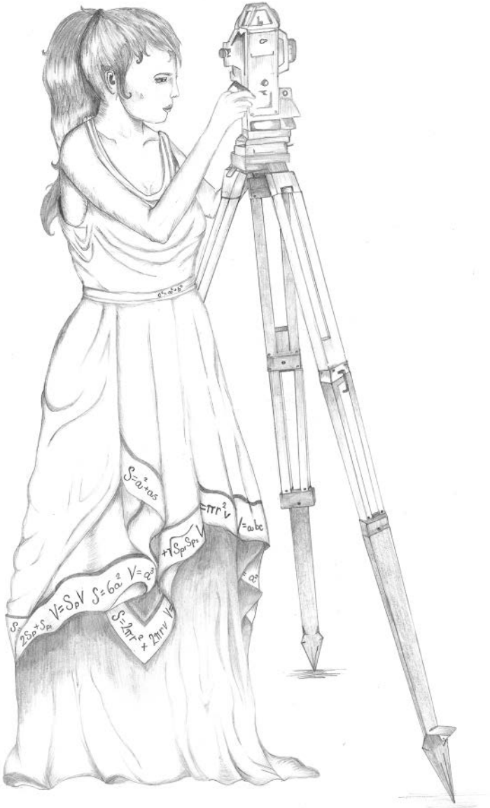
Sedm svobodných umění – geometrie, Adriana Peremilovská, © 2019