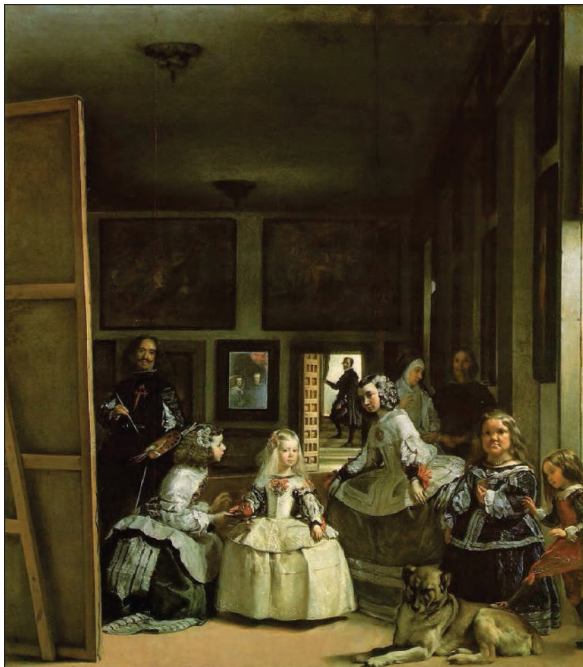
Diego Velázquez: Dvorní dámy, 1656

zův obraz Las Meninas . Na tomto obraze je každá ze tří dimenzí jasně viditelná. Pozorovatel může vidět zcela ostře každý detail od psa po pána domu ve dveřích a pár v zrcadle. Tady je obraz, o němž mluvíme: